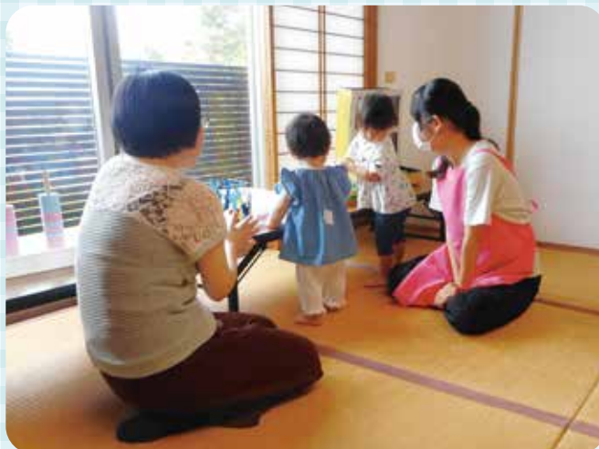
▲なつボラ(青少年ボランティア体験学習)の様子