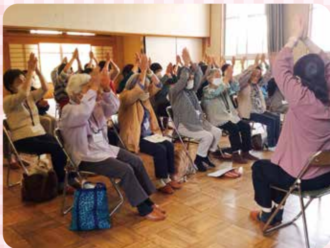
▲ふれあいサロンの様子

「第4次地域福祉計画」に基づき、地域住民が主体的に行うふれあいサロン活動や見守り活動等の福祉活動を積極的に支援するとともに、民生委員児童委員協議会や老人クラブ連合会の活動を支援し、地域福祉を推進します。また、地域福祉懇談会等を通じて地域住民の地域福祉活動への関心を高めます。