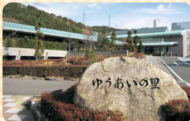
▲豊川市ふれあいセンター