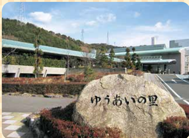
▲豊川市ふれあいセンター