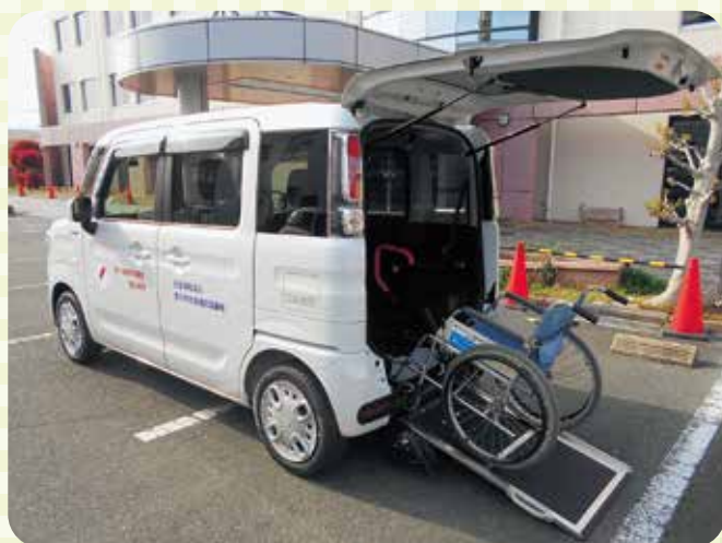
▲貸出用福祉車両(ためき号)

コミュニティソーシャルワーカー(CSW)を配置し、だれもが安心して暮らせるまちづくりを推進するため、総合的な相談と地域福祉活動の支援等を行います。また、車イスの貸出や福祉車両の貸出事業等の各種事業を行うとともに、安心して子育てのできる環境づくりのため、子育て相談窓口の設置や、子育て中の家庭に対して子育てヘルパーの派遣を行います。