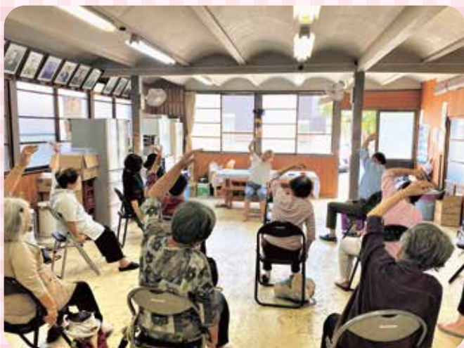
▲ふれあいサロンの様子

「第4次地域福祉計画」に基づき、地域住民が主体的に行うふれあいサロン活動や見守り活動等の福祉活動を積極的に支援するとともに、民生委員児童委員協議会や老人クラブ連合会の活動を支援し、地域福祉を推進します。また、地域福祉懇談会等を通じて地域住民の地域福祉活動への関心を高めます。