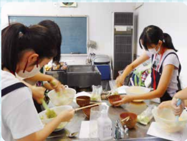
▲青少年ボランティア体験学習の様子