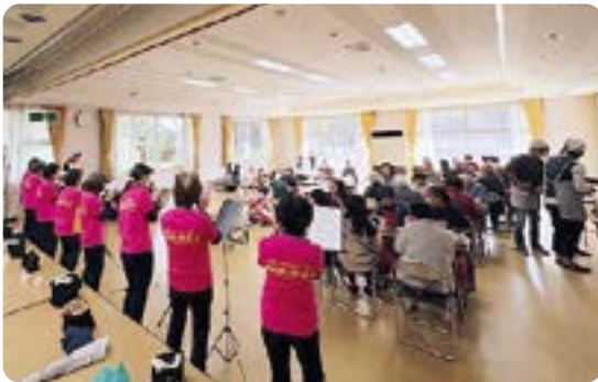
伊奈ふれあいサロン×「に～歩」