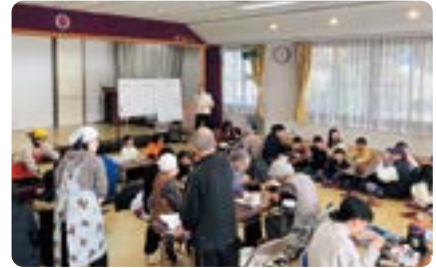
みんなでわいわい