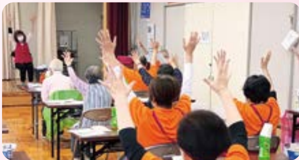
サロン活動の様子