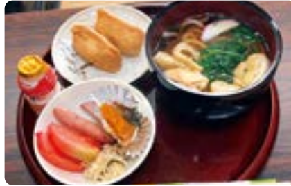
月替わりメニュー