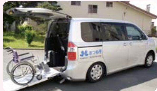
福祉車両の貸し出し