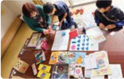
折り紙や塗りに挑戦