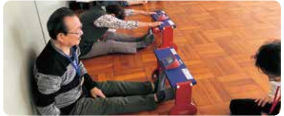
長座体前屈測定に挑戦 前回の自分と勝負!