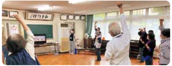
はじまりの体操で活動スタート!