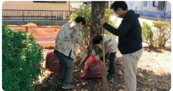
落ち葉がたくさん