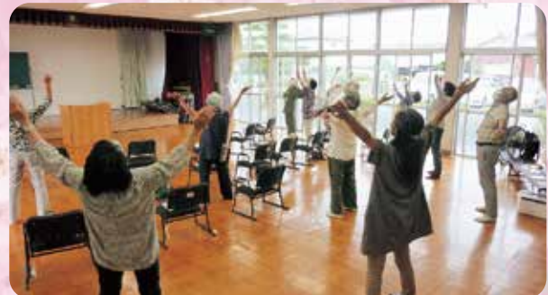
麻生田図書サロン