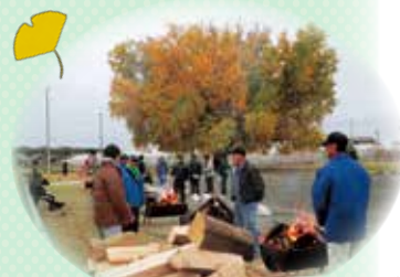
大和大イチョウ祭りの様子