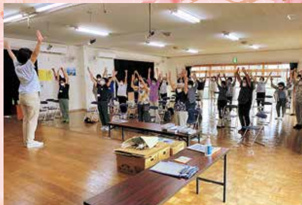
ふれあいサロンあいあい