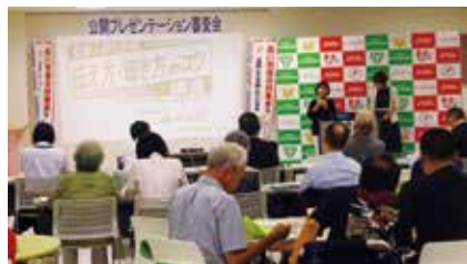
令和元年度第2次審査公開プレゼンテーションの様子（令和2年度は書類審査にて実施）