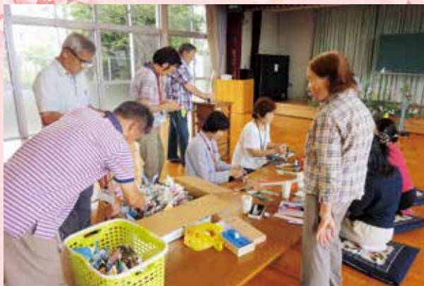
麻生田図書サロン