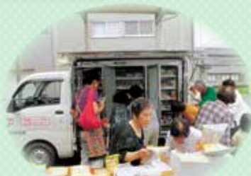
移動販売車を誘致し、皆でお買い物をしている様子

我々の福祉会は60～75歳の総勢14名。チームワークの良さで頑張っていますが、後継者がいないこと、若い世代の入会が少ないことが課題です。