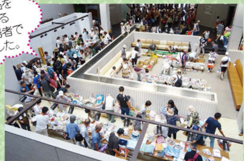
▲バザー会場の様子