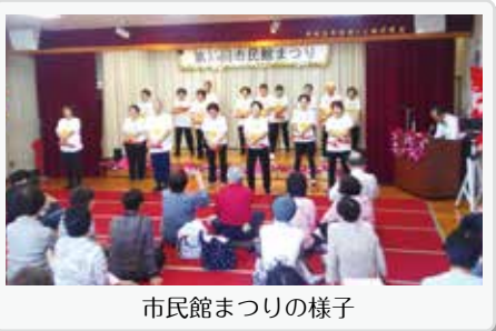
市民館まつりの様子

『サロンって何ですか?』と聞かれることが多いです。まだまだ地域の活動が広く浸透されていないのかもしれませんが。サロンに参加したことがない方に興味を持ってもらえるよう回覧板や口コミなどを通じて、参加者の募集案内だけでなく、どんなことをしているのかの「見える化」と「積極的な広報活動」が課題に感じています。 サロンとは? 地域の集会所や公民館等で地域住民が集まり、一緒に健康体操や物づくりなどをして楽しく交流する場です。社会参加や健康維持・生きがい、地域の課題発見などに繋がっています。