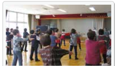
サロンでの健康体操の様子

中部南地区には4つの町内があり、町内ごとに見守り支え合い活動や月1回程度ふれあいサロンを開催しています。町内ごとに活動内容は異なりますが、サロンではゲームをしたり一緒に食事を楽しんだり、学習会(防災や豊川市の歴史に関すること)を開催するなど、誰でも気軽に参加しやすい地域コミュニケーションの場をつくっています。また、毎年10月に開催される『市民館まつり』では、4町内合同で企画・運営し、地区を盛り上げています。当日は、委員会や地域福祉活動の紹介パネル(各福祉会やふれあいサロン活動での様子・広報活動など)を展示したり、サロン内で作った小物や彫金などの作品を展示して、地域の福祉活動について理解を深めるきっかけづくりをしています。