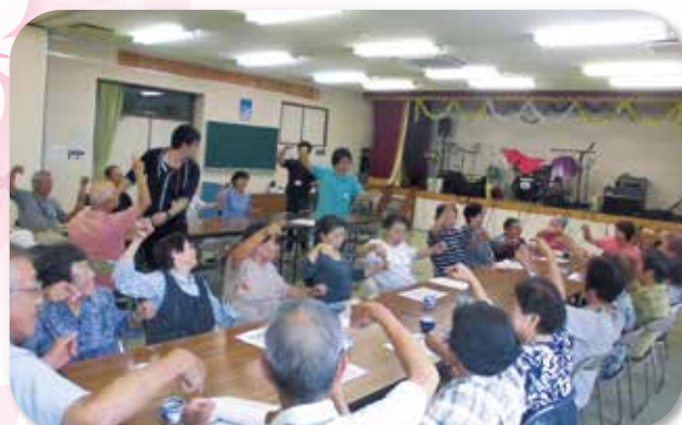
金沢やまざくらサロン