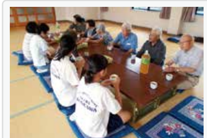
桜町ふれあいサロン 中学生ボランティアと茶話会の様子