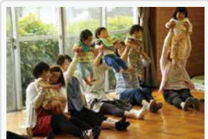
子育てサロン「つぼみ」の様子