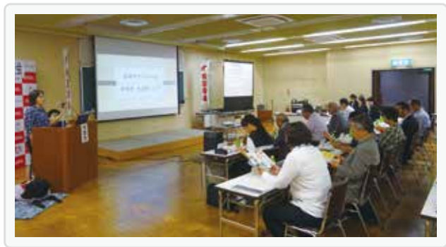
平成30年度第2次審査公開プレゼンテーションの様子