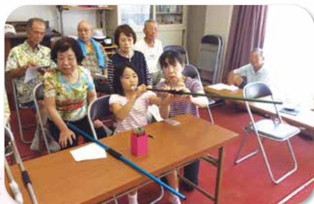
小坂井住宅あじさいサロン