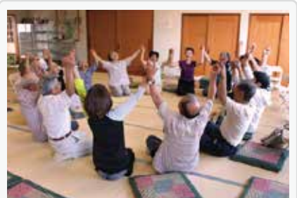
歳子いきいき健康サロン 終了時の大笑いの様子

地域の福祉会が町内会に所属している桜町地区の強みを生かし、委員会が連区や町内会と協働して活動が継続できるように、私たち社会福祉協議会は活動者の皆さんに寄り添い、皆さんが進める「桜町の地域福祉活動」を応援していきます。