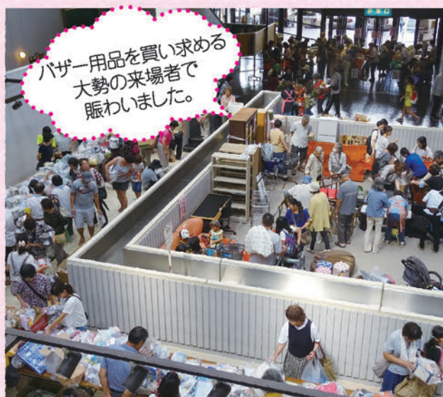
▲バザー会場の様子

なお、バザー収益金 962,783円 は、豊川市社会福祉協議会にご寄付いただきました。民生委員児童委員の方々、たくさんの物品を寄贈していただいた市民の方々に感謝いたします。