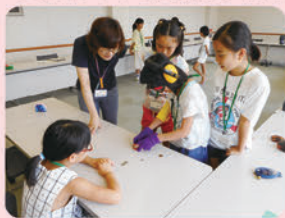
第1回目(7/24) 「認知症キッズサポーター になろう!」 の様子

第1回目(7/24)は「認知症キッズサポーターになろう!」、第2回目(8/3)は「高齢者施設でボランティア体験しよう!」を実施しました!