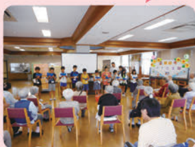
第2回目(8/3) 「高齢者施設で ボランティア体験しよう!」 の様子