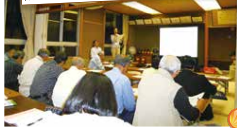
福祉出前講座「成年後見制度と日常生活自立支援事業」の様子

社会福祉協議会の各地域窓口または、ウイズ豊川(☎83-5211)地域福祉課地域支援係までお問合せください。