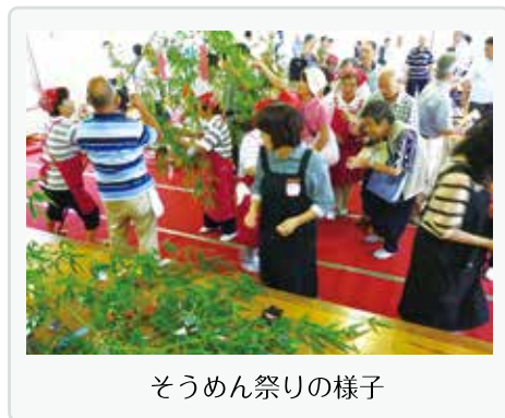
そうめん祭りの様子

国府福祉会では、福祉勉強会である出前講座を春と秋の年2回開催し最近では「盲導犬について」「介護保険制度について」「認知症について考えてみよう」等のテーマで勉強しました。また、国府地区のボランティア団体である「こすもすの会」が主催する夏の〈そうめん祭り〉、冬の〈芋煮会〉にお手伝いとしても参加しています。