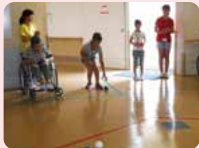
第2回目(8/24) 「障がいのある方と ポッチャで遊ぼう!」の 様子