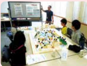
第1回目(8/4) 「ミニチュア模型で まちづくり体験しよう!」の 様子

第1回目(8/4)は「ミニチュア模型でまちづくり体験しよう!」第2回目(8/24)は「障がいのある方とポッチャで遊ぼう!」第3回目(9/25)は「きみも防災ヒーロー!楽しくしっかりまなぼうさい!」でした。