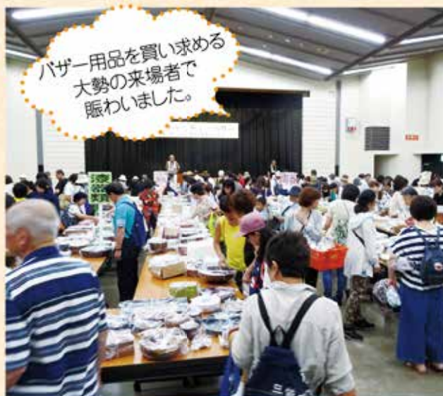
▲バザー会場の様子

なお、バザー収益金1,183,603円は、豊川市社会福祉協議会にご寄付いただき感謝いたします。