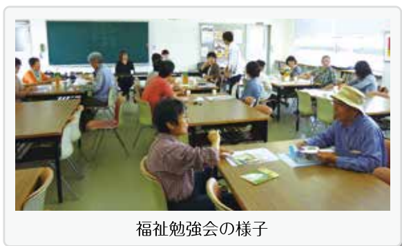
福祉勉強会の様子

国府連区の行事として9月に敬老祝賀会が開催され国府福祉会は婦人会とともに同会を共催し、11月の連区防災訓練には婦人会と一緒に炊き出しを行っています。