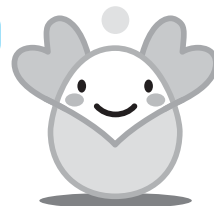
ボラたまマスコットキャラクター