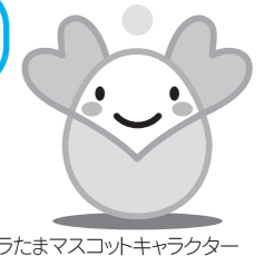
ボラたまマスコットキャラクター