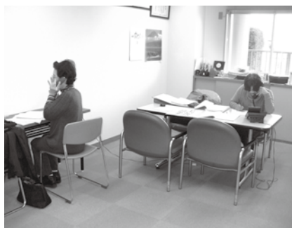
ふれあい電話の様子