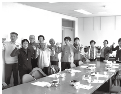
小坂井サロンの様子