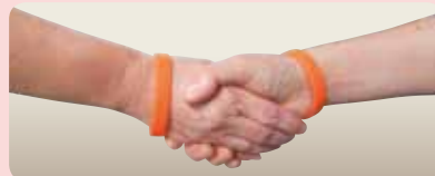
オレンジリング(サポーターの印)