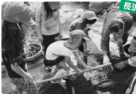
▲長沢保育園児と芋掘り(長沢きらく会)