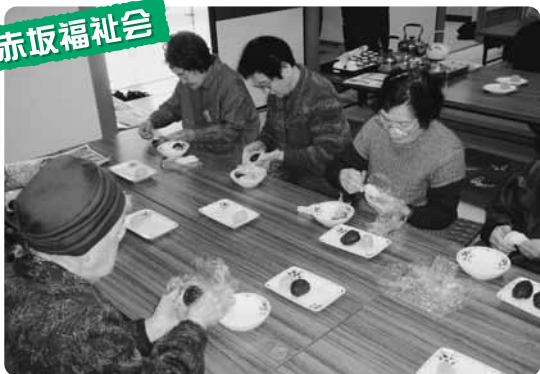
▲ぼた餅作り(よしのぼとサロン)