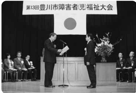
第13回障害者(児)福祉大会