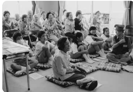
つるサロン(音羽地区)