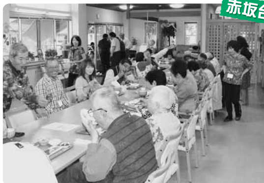
▲暮らしの支え合い活動登録者を招いて食事会