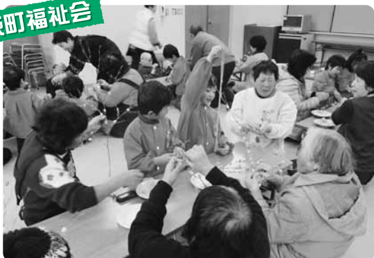
▲萩保育園児と餅花作り(萩サロン)