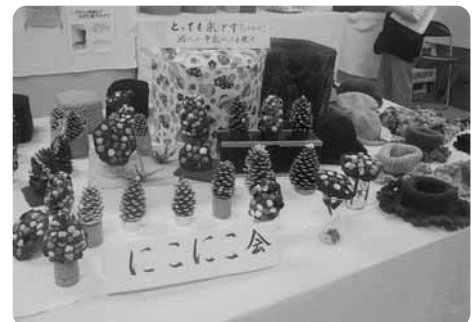
にこにこ会 三上地区市民館まつり 作品展