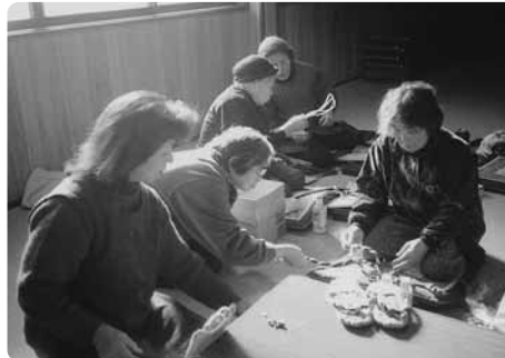
にこにこ会 布ぞうり作り

にこにこ会は、毎月第3土曜日の午後1時から、三上第2区集会所で開催しています。お茶を飲みながらおしゃべりができる会があったらいいなと、老人クラブのメンバーに声をかけたのがきっかけで、平成15年4月に始まりました。参加者は8名ほどで、毎回当番を決めて行っています。内容は、歌、ゲーム、小物づくりなどで、今年は作品を地区市民館まつりに出品しました。にこにこ会の活動は9年目を迎えますが、これからも気軽に集まって楽しく過ごせる場所として続けていきたいと思っています。