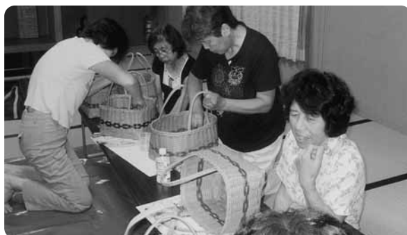
サークルあじさい かご作り