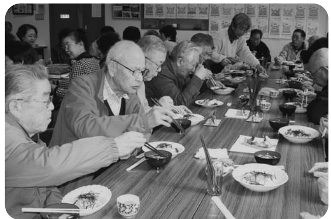
古当区ふれあいサロンの様子