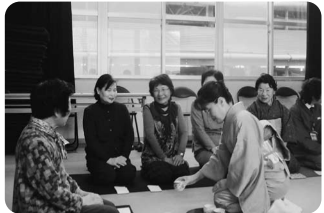
茶屋区ふれあいサロンの様子