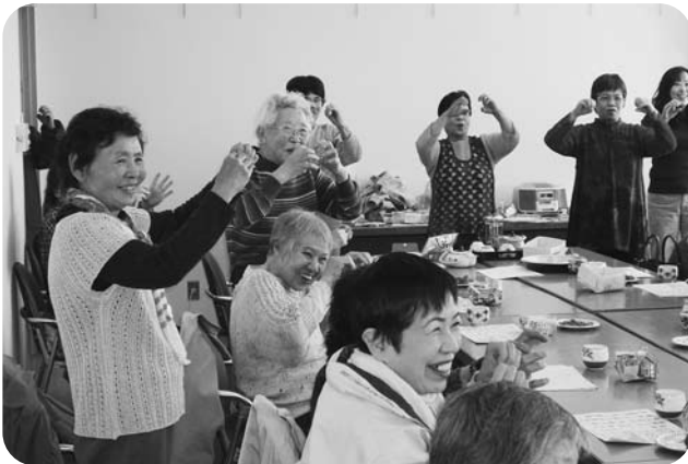
小坂井ふれあいサロンの様子

各町内会のふれあいサロンでは、季節行事に合わせた作品づくりやレクリエーション、茶話会や食事会などをボランティアさん達の創意工夫で行っています。同じ町内会で生活する他の高齢者などとふれあい、おしゃべりを楽しみながら、孤立を防止し生きがいや仲間づくりを促すための貴重な活動となっています。まだ参加したことがない方もぜひご参加ください。