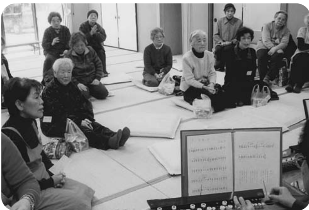
西小坂井ハートサロンの様子