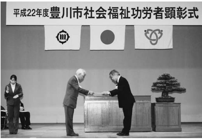
平成22年度豊川市社会福祉功労者顕彰式