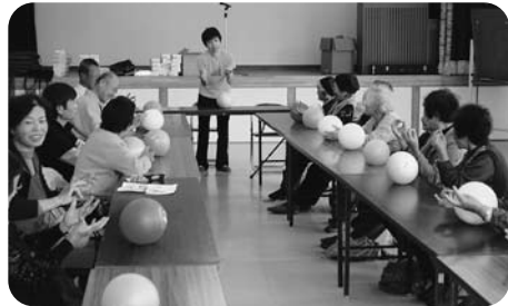
金沢地区 やまざくらサロン