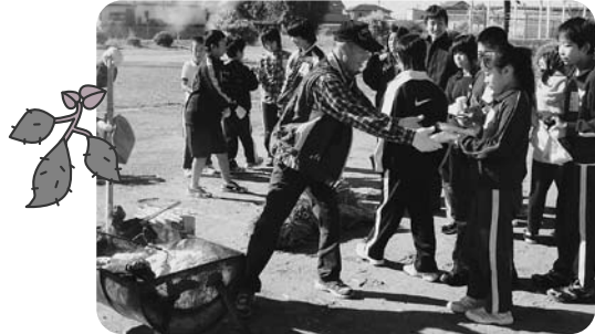
一宮南部小学校 焼き芋交流会の様子

いそがず、あわてず、無理をしないで、自分たちの地域に、自分たちの町にあった福祉活動をめざします。