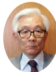
社会福祉法人 豊川市社会福祉協議会